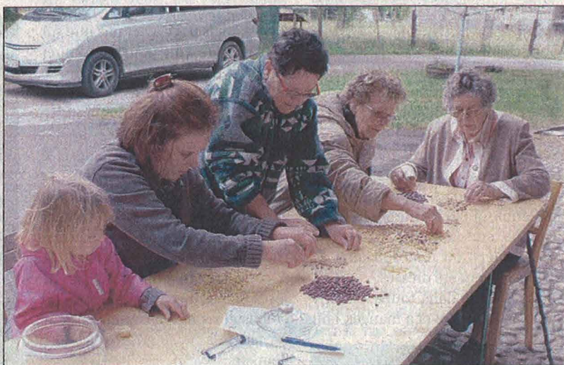
Lors du rallye, un poste de rapidité de tri de pâtes, pois et haricots...