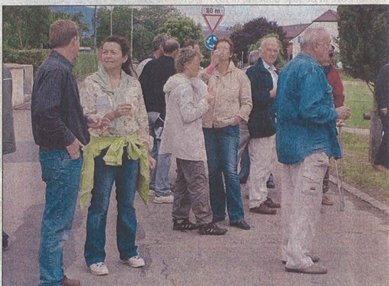
Les discussions allaient bon train à l'heure de l'apéritif.