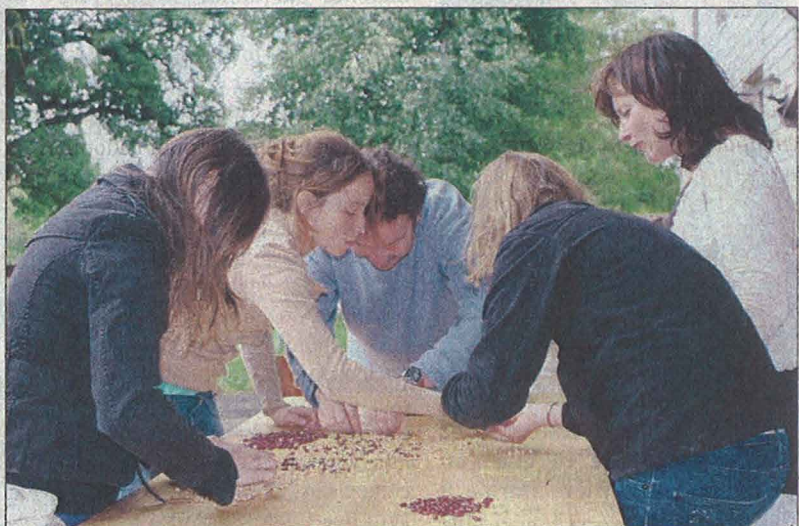
... avec une technique propre à chaque équipe engagée.