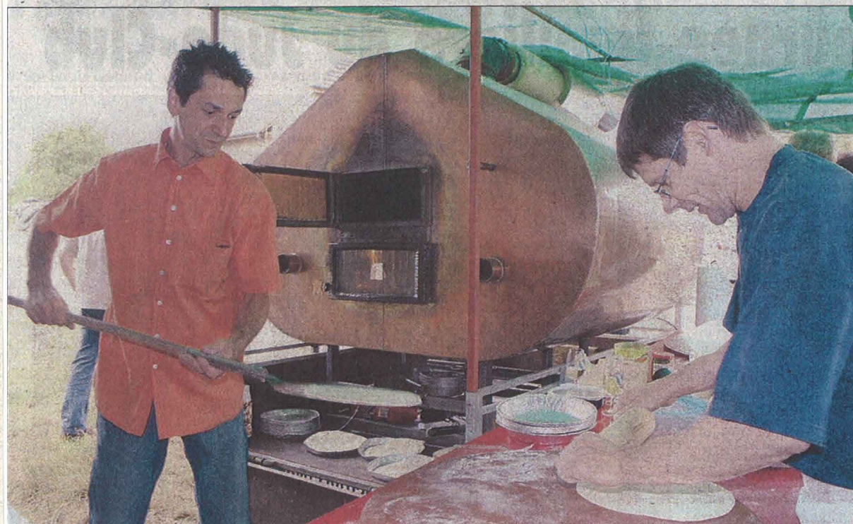
Le choix entre quatre variétés de pizzas cuites à la minute.